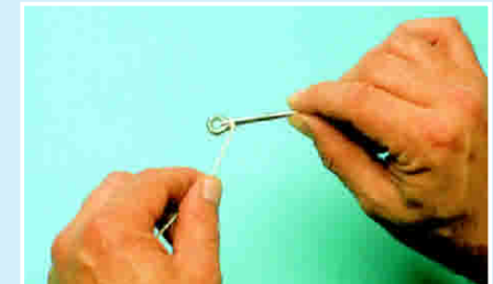
Bd 5: Ersten Schlag legen.

Achtung: Genau auf die entscheidende Drehung achten – das lange Schnurende liegt unter der Schlaufe!