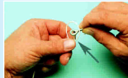
Bd 4: Schlaufe über das Öhr.