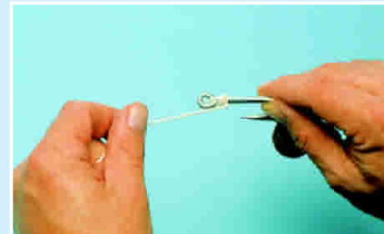
Bd 6: 3 - 5 halbe Schläge legen.

Achtung: Genau auf die entscheidende Drehung achten – das lange Schnurende liegt unter der Schlaufe!