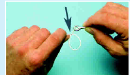
Bd 3: Schlaufe legen.