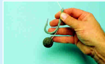
Bd 2: Haarlänge einstellen.